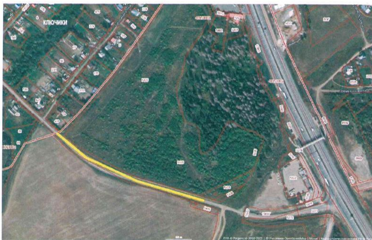
Схема для разработки проекта планировки и проекта межевания части территории Пальниковского сельского поселения Пермского муниципального района Пермского края с целью размещения линейного объекта – автомобильная дорога «Пермь-Екатеринбург» - Ключики